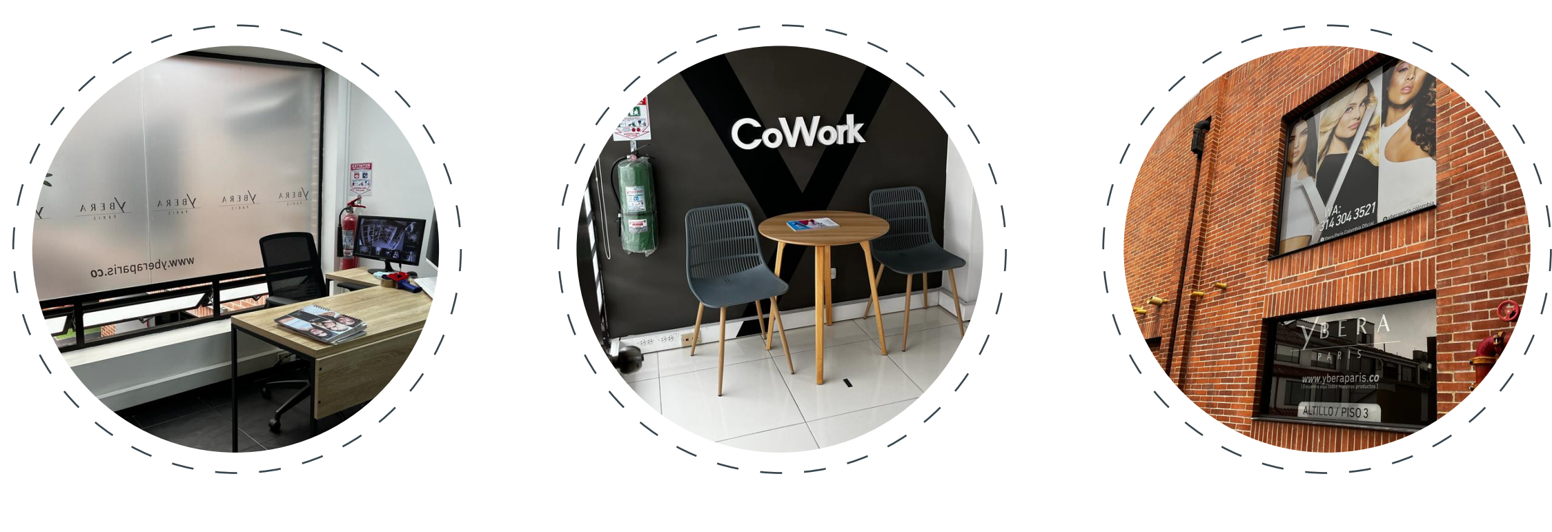
Fotos de referencia oficina cliente actual - feb 2024